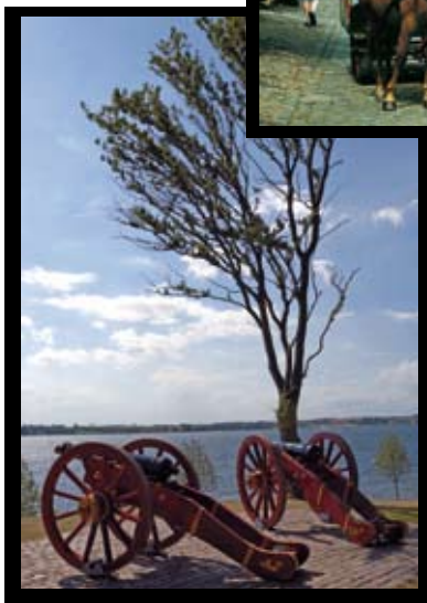
Voigts Minde - Faaborg