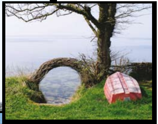
Blick aufs Meer, Assens