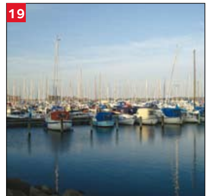
Auserwählte ffinische Hfen: 30) Tel-ka Marina Middelfart 32) Odense Hafen 14) Faaborg Hafen 51) AEraskbing Hafen 47) Troense Hafen 7) Bogense Marina 44) Svendborg Hafen 26) Lundeberg Hafen 37) Rudkbing Hafen 31) Nyborg Yachthafen 1) Assens Marina 19) Kerteminde Marina