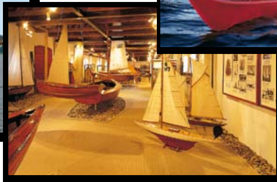
Nordeuropäisches Seglertmuseum, Valdemars Schloss