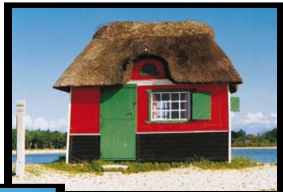
Badehaus auf Ærø