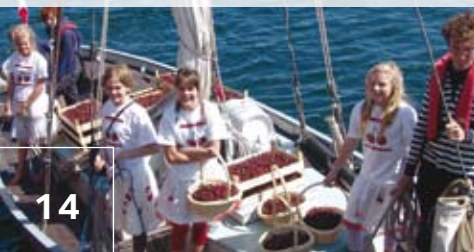
TAG DES INSELMEERES LANGELAND