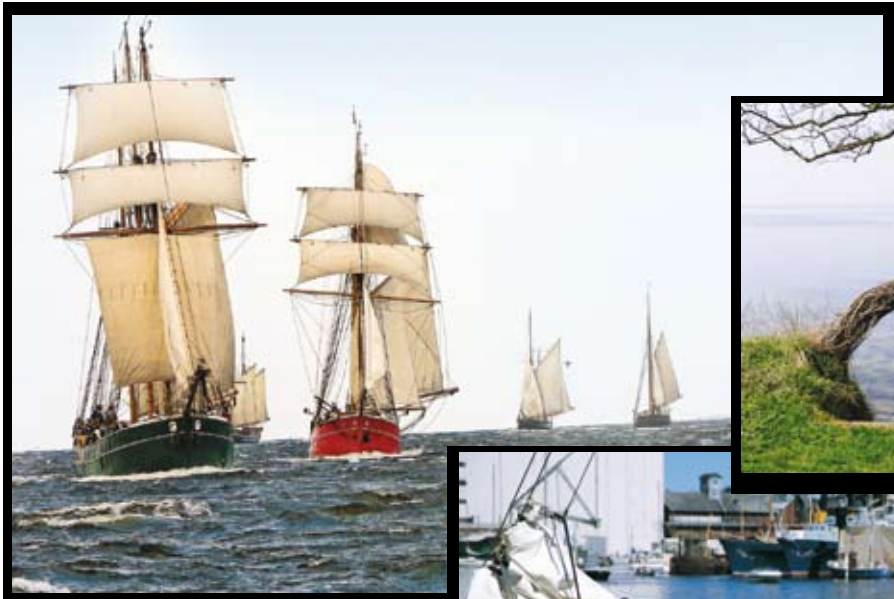
Regatta „Rund Fünen“

Wer in der Dänischen Südsee in einem Restaurant oder einem alten „kro“ (Krug) nach dem typischen Gericht fragt, dem wird „rødspætte“, eine in Butter gebratene Scholle, angeboten werden. Und man kann sicher sein, dass der Fisch frisch aus dem Inselmeer kommt. Dazu trinkt man dänischen Landwein: Also die weltbekanntesten dänischen Biersorten Tuborg oder Carlsberg.