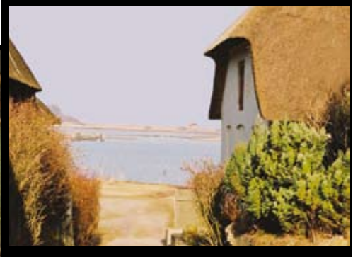
Torø Huse