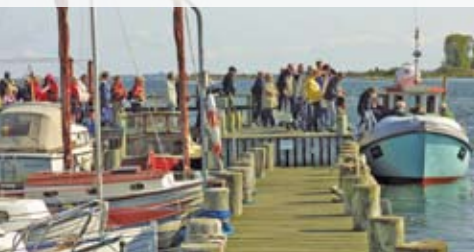
TAG DES FJORDES KERTEMINDE