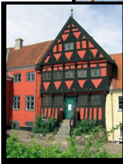
Das Haus von Hemmer Friiser