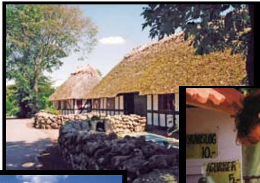
Idylle auf Bjørnø