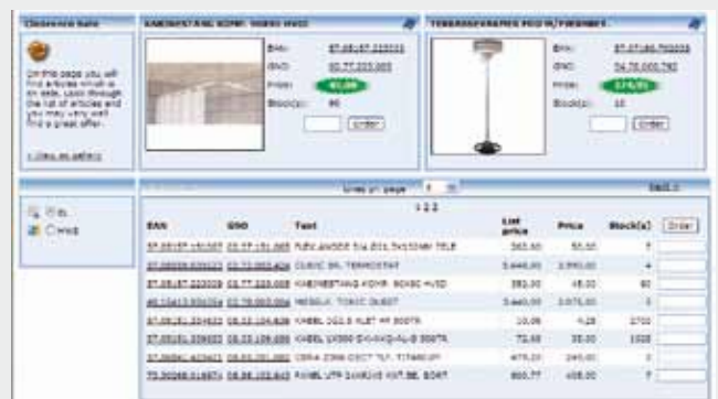
Eksempel: Andre funksjoner