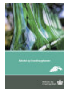
Øl, vin og spiritus skal nydes moderat. Motions- og Ernæringsrådets gennemgang af eksisterende viden om "Alkohol og livsstilssygdomme" viser vejen til, hvordan vi opnår de gavnlige effekter af alkohol uden at blive syge eller fede.

I dag overskrider 14 % af danskerne anbefalingerne af, at mænd højst drikker 21 genstande om ugen - kvinder højst 14. Det "usunde" alkoholforbrug findes oftere blandt højtuddannede end lavtuddannede og oftest blandt unge (16-24 år) og i "rødvinsgenerationen" (45-64 år).