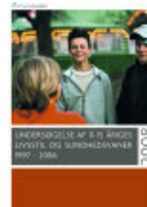
Siden 1997 har Sundhedsstyrelsen har fulgt de 11-15 årige. Konklusionen er klar: Unge er bedre end deres rygte.

Sundhedsstyrelsens undersøgelse viser desuden, at der ingen sammenhæng er imellem overvægt og de mest udsældte symboler fra ungdomsværelset. Blandt de unge, der ser meget TV, spiller PC eller spiser meget slik, fastfood og drikker læskedrikke, er vægten ikke højere end for andre unge. En tilsvarende undersøgelse fra 2007 viste en sammenhæng imellem overvægt og manglende indtag af morgenmad. I årets rapport er eneste sammenhæng ironisk nok, at unge med et stort forbrug af slik, chokolade og is typisk skal findes blandt de unge, der er slankeste.