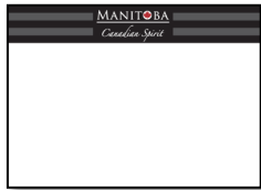
Prisskilte til butikken