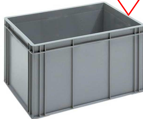
MANITOBA DEJKASSE med låg (CBP vare nr. 662208)

Er du villig til at ændre rutiner og bruge din faglige baggrund i kampen om kunderne og indtjeningen...?