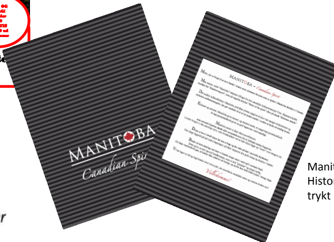
Manitoba pose til at sælge brødet i. Historien om Manitoba og det gode håndværk er trykt på bagsiden af posen.