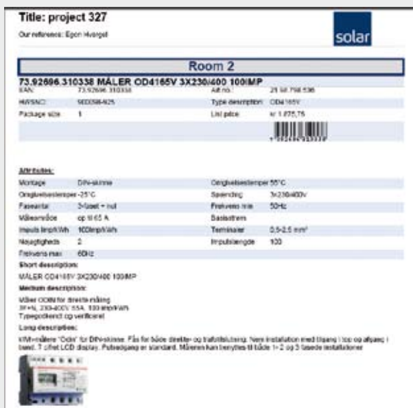
Eksempel: Individuelle kataloger

Når du skriver ut dokumentasjonen, oppretter systemet automatisk et Adobe PDF-dokument med all nødvendig informasjon direkte fra Solars hovedkatalog. Som en ekstra funksjon er det mulig å feste ekstra dokumentasjon (fra tredjepart) til prosjektdokumentasjonen via tilgjengelige koblinger.