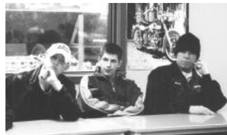
Elever på teknisk skole lytter opmærksomt på beretning fra en pårørende til et trafikoffer.

Pga. kampagnens store succes er GODA allerede gået i gang med at planlægge en ny ”Stodder Med Stil”-kampagne til næste forår, igen i samarbejde med Metal Ungdom og Rådet for Større Færdselssikkerhed. EU-Kommissionen har allerede bebudet, at den gerne vil støtte en fortsættelse af kampagnen med en fordobling af støtten i forhold til i år.