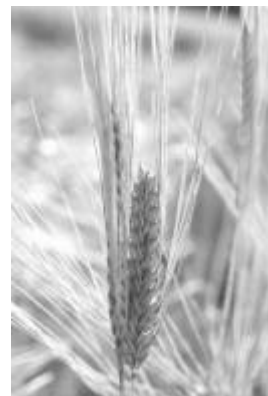
Maltbyg - øls hovedingrediens.

Det kan derfor ikke undre at der i store befolkningsundersøgelser er påvist en positiv sammenhæng mellem en moderat indtagelse af øl og en høj BMD (tæthed af knoglevævet).