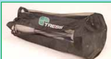
1 st förvaringsväska

Tress nya Inlärningspaket till matematikundervisningen består av: