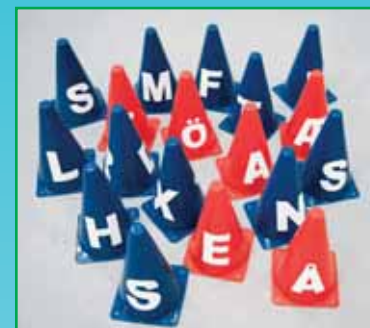
1 set bokstavskoner