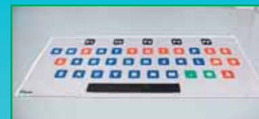
1 st tangentbordsmatta