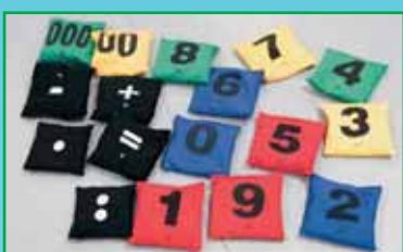
2 set sifferärtpåsar