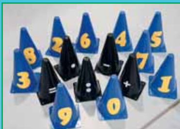
2 set sifferkoner