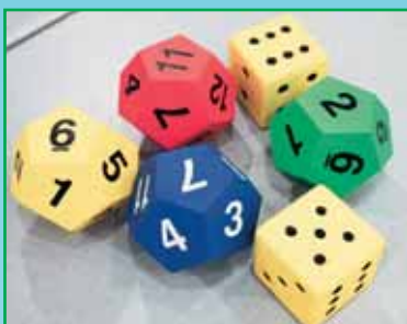
1 set stora siffertärningar