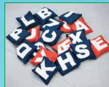
2 set bokstavsärtpåsar