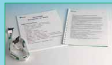
1 set inspirationsmaterial och 1 set uppgiftsstenciler