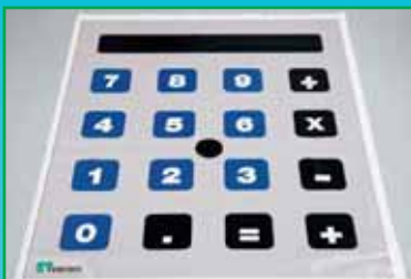
2 st miniräknarmattor