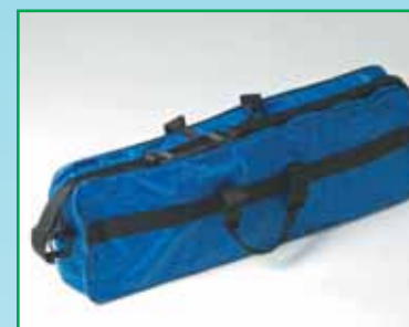
1 st förvaringsväska

Tress nya Inlärningspaket till svenskundervisningen består av: