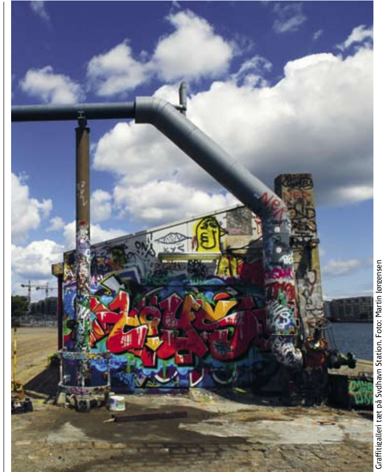
Graffiti-galleri tæt på Sydhavn Station.