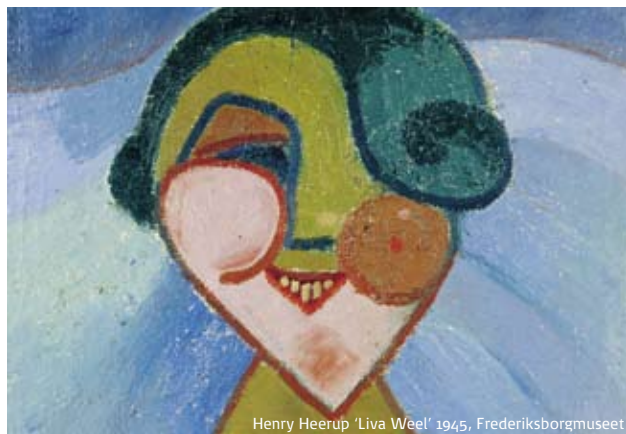
Henry Heerup 'Liva Weel' 1945, Frederiksborgmuseet

Hvis du trænger til at mærke historiens vingesus, skal du stå af i Køge. I den smukke gamle bymidte kan du både se Danmarks ældste fungerende rådhus, opført i 1552, og Danmarks ældste bindingsværkshus fra 1527.