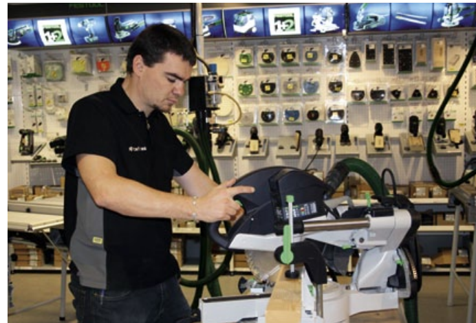
Kig forbi vores Festool-testcentre hos Carl Ras i Herlev, Emdrup, Sjællandsbroen, Odense, Århus og Holstebro.

I flere af vores engroscentre har vi desuden etableret testcentre, hvor du kan afprøve værktøjet, inden du handler. Derudover har du mulighed for at teste flere af vores produkter i 30 dage på byggepladsen før evt. køb.