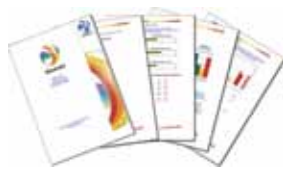
Insights Full Circle Profil 360grader: præferencer