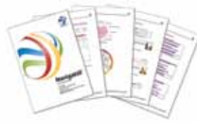
Salgeffektivitetsprofil 360grader: salgskompetencer