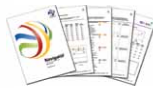
Transformational Leadership 360grader: lederkompetencer

www.insightsdanmark.dk www.insightskurser.dk info@insightsdanmark.dk