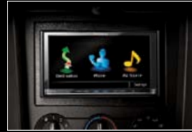
Automobilová audiovizuální technika/navigace

Podrobné informace o zásadách ochrany životního prostředí firmy Pioneer naleznete na následujících webových stránkách: www.pioneer.eu/environment