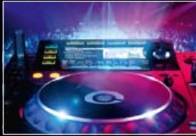
Výrobky pro diskotéky