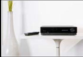
Audio & video

OBJEVTE ZNAČKU PIONEER: WWW.CZ.PIONEER.EU - WWW.SK.PIONEER.EU