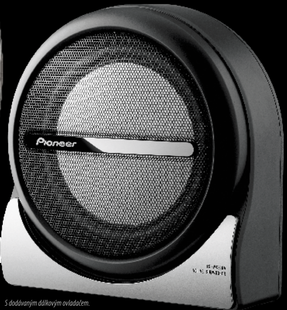
S dodávaným dálkovým ovladačem.

TS-WX210A MAX. VÝKON 150 W 20 CM AKTIVNÍ SUBWOOFER