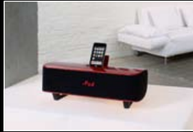
Reproduktorový systém iPod