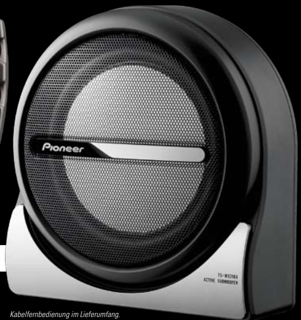
Kabelfernbedienung im Lieferumfang.