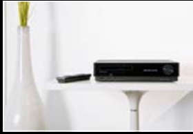
Audio & Video