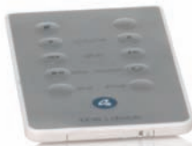
The V dock Fernbedienung