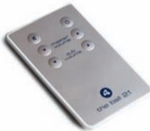
The ball 2.1 Fernbedienung