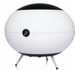
the ball 2.1