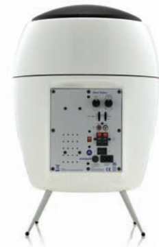
70W RMS Class D Active Verstärker