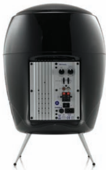
50W RMS de amplificador

Es el compañero perfecto para el Minipod SE. Satisface el ocio y cine en casa en espacios reducidos, sorprende a quien los escucha con un sonido grande en un sistema pequeño.