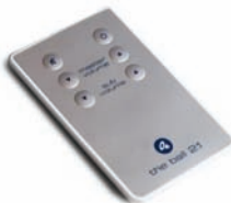
El mando a distancia de The ball 2.1