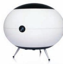
The ball 2.1