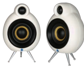
The micropod SE