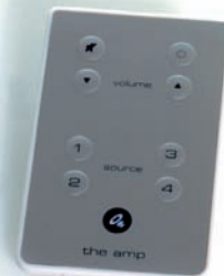
El mando a distancia de The amp

- encaja en casi todas los sitios. Se ofrecen con 2x50W son solo un 0,12% de distorsión, entre 1 W y 25 W, es revolucionario, y sus 4 entradas estéreo, mas el mando a distancia, le dará una experiencia completa. Obtenga la máxima expresión del sonido con Micropod SE, Minipod, Bigpod, The Drop o Micropod SE junto con el The Ball, The Bass Station o Minibase. Combinelo con el Megapod, impresionante.