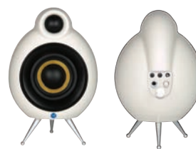
micropod SE Active