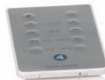
El mando a distancia