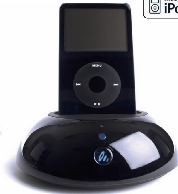
El mando a distancia de The V Dock