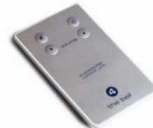
El mando a distancia de The ball