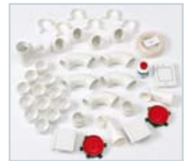
Verbindungsstücke Paket 2