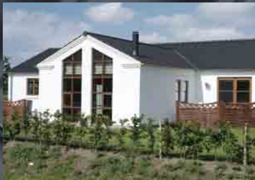
B&C DOBBELT-S BETONTAGSTEN