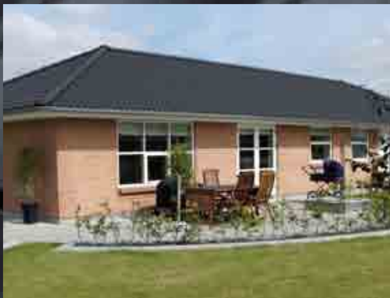
MONIER BETONTAGSTEN SORT

Hvis du kan spare 3.000 kroner om året – som i eksemplet ovenfor – betyder det, at de 3.000 kroner kan forrente et lån på 75.000 kr. ved en rente på 4%, og hvis du skal skifte tag, og tagkonstruktionen er let tilgængelig, ja så kommer du et godt stykke vej for 75.000 kroner.