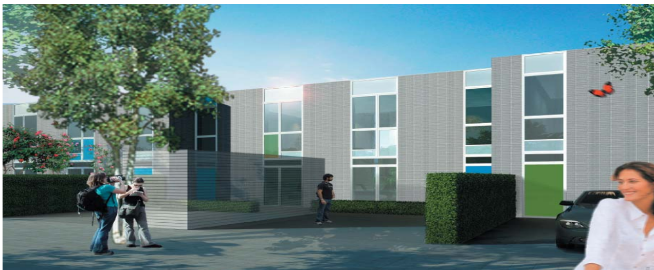
En skitse af FSP Pensions nye byggeri af 32 rækkehuse i Risskov nord for Århus.

FSP Pension har midt i Finanskrisen erhvervet en attraktiv byggegrund på Grenåvej ved Risskov nord for Århus. Her indleder entreprenørvirksomheden KPC Byg i efteråret 2009 opførelsen af 32 rækkehuse i to etager. Boligerne bliver opført og indrettet i kvalitetsmaterialer, og FSP Pension forventer, at beliggenheden tæt på både by og natur blandt andet vil tiltrække primært unge familier. Rækkehusene forventes at være parat til indflytning fra efteråret 2010.